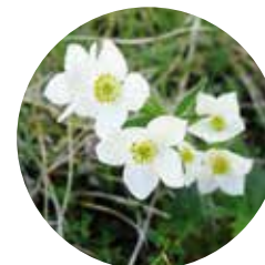
Renoncule des Pyrénées ( Ranunculus pyrenaicus )