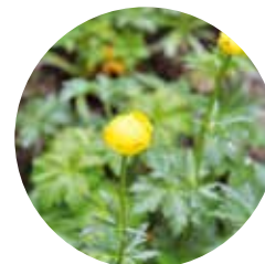
Trolle d'Europe ( Trollius europaeus )