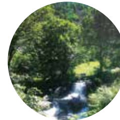
Rivière de Claror et Perafita