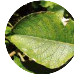
Saule marsault ( Salix caprea )