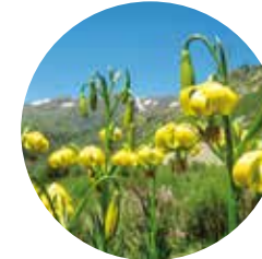
Lis des Pyrénées ( Lilium pyrenaicum )