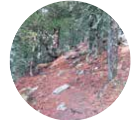
Forêt de la Vallée du Riu

Cette extraordinaire vallée, qui recrée à la perfection ses origines glaciaires, accueille l'un des plus beaux lacs d'Andorre, d'une superficie de plus de 4 hectares, ainsi que deux autres lacs moins étendus, qui rendent le parcours encore plus attrayant.