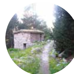
Cabane de la Farga