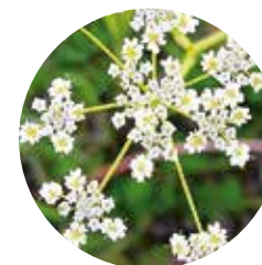
Anis des prés ( Carum carvi )