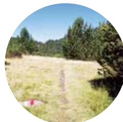
Fôret de la Tosa