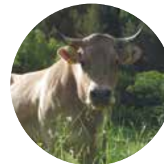
Vache brune d'Andorre