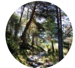
Camino dels Cortals

El camino del Solà se encuentra en la parroquia de la Massana, entre las poblaciones de Anyós y l'Aldosa. En esta excursión podemos adentrarnos por los bosques de la zona entre abedules, avellaneros y otros árboles silvestres. A partir de los 2.000 metros de altitud, el pino silvestre tiene una gran presencia. Desde la Collada de l'Estall, podemos disfrutar de unas vistas extraordinarias del pico de Casamanya y los Cortals de Sispony.