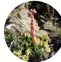
Siempreviva ( Sempervivum Montanum )