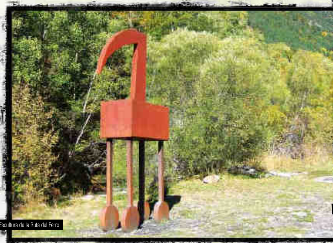
Escultura de la Ruta del Ferro

La Ruta del Ferro a Andorra -Ruta del Hierro- es un itinerario cultural que forma parte del itinerario transfronterizo la Ruta del Ferro als Pirineus , el cual recibió la mención de honor del Consejo de Europa en el mes de noviembre del 2004, y coordina actividades con instalaciones de Cataluña, Aquitania, Arieja, Guipúzcoa y Vizcaya.