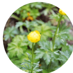
Flor de San Pallari ( Trollius europaeus )