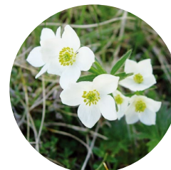
Ranúnculo del pirineo ( Ranunculus pyrenaicus )