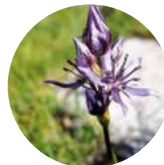
Ewertia ( Swertia perennis )