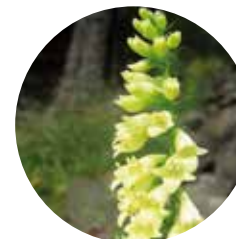
Digital amarilla ( Digitalis lutea )