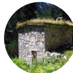
Cabaña de la Farga