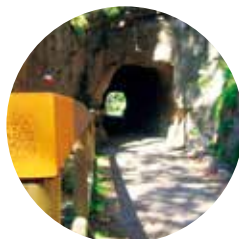
Túnel en el camino dels Matxos

Fontverd: Nombre compuesto de font -fuente, en castellano-, del latín fons , y de verd -verde, en castellano-, del latín viride . En efecto, en la comarca hay nacimiento de aguas sobre el zócalo granítico -filtrador- y esto hace del lugar un jardín espontáneo por la abundancia de plantas.