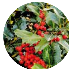
Acebo común ( Ilex aquifolium )