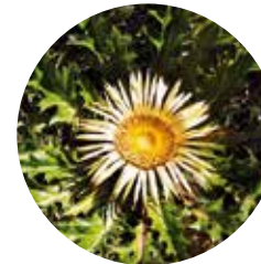
Carlina cinara ( Carlina acanthifolia )