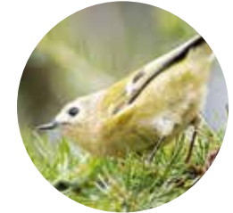
Reyezuelo sencillo ( Regulus regulus )

El lago de Baix, conocido como el lago del Siscaró, con una superficie de una hectárea, se encuentra a 2.325 metros de altitud, en el valle de Incles, valle que se asienta sobre un relieve marcado por la acción de los glaciares cuaternarios. Un agradable acceso en coche nos acerca hasta el aparcamiento del puente de la Baladosa, donde empieza el recorrido.