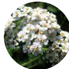
Milhojas ( Achillea millefolium )