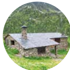
Refugio Borda de Sorteny