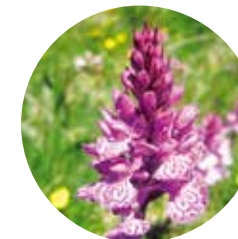
Orquídea moteada ( Dactylorhiza maculata )

En el 2010 se cumplieron 10 años de existencia del parque natural del Valle de Sorteny, y es sin duda un buen momento para conocerlo a través de esta agradable ruta de poco más de 4 kilómetros y un desnivel de unos 200 metros, resiguiendo en parte los senderos de interpretación del parque.