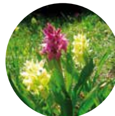
Orquídea saúco ( Orchis sambucina )