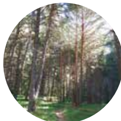
Bosc de Jou

Jou: Del latín lugu , “que tiene perfil redondeado”.