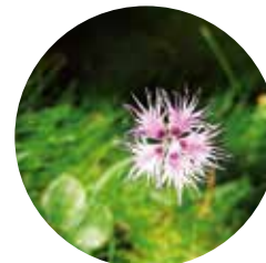
Clavell de pastor ( Dianthus hyssopifolius )