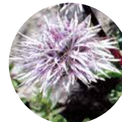
Lluqueta de roca ( Globularia cordifolia )