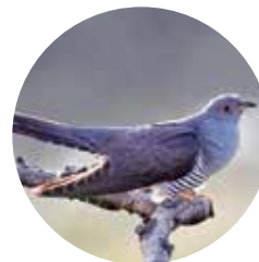
Cuco ( Cuculus canorus )