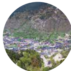
Vistas de Encamp