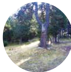
Llegando a Conangle

Juberrí: del latín iugus , "yugo", con la terminación erri , del vasco, "lugar o pueblo". De este núcleo urbano, aparecen diversas denominaciones y, quizás, agrupaciones separadas.