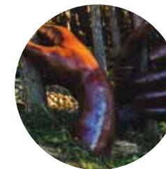
Jardines de Juberrí

El itinerario que aquí se presenta tiene salida en el pueblo de Juberrí y corresponde a un tramo del GRP, Gran Recorrido País, que da toda la vuelta a Andorra. El punto de salida se encuentra rodeado de álamos negros ( Populus nigra ) y fresnos ( Fraxinus excelsior ), que aprovechan la humedad de un pequeño torrente.