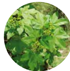
Arce campestre ( Acer campestre )