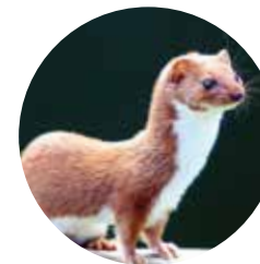
Comadreja ( Mustela nivalis )