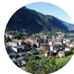
Vistas de Encamp