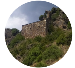
Sant Martí de Nagol

Este itinerario comienza en el pueblo de Sant Julià de Lòria y sube hasta el pueblo de Nagol por el camino de Sant Martí. Este camino comunica el pueblo de Nagol con la iglesia de Sant Martí y el prado y los bancales que hay junto a esta iglesia. Sale del extremo norte del pueblo de Nagol, flanquea la vertiente de la montaña con una pendiente ligera y supera un collado en el centro. A ambos lados de este collado, el camino está empedrado; también hay algunos tramos por encima de un terraplén de piedra seca. Cuando llega cerca de Sant Martí, está cortado por la roca.