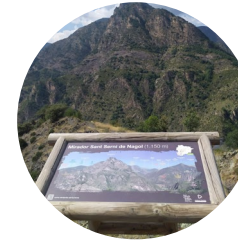
Mirador de Sant Serni de Nagol