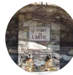
Font de l'Artic