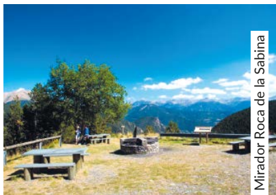
Mirador Roca de la Sabina