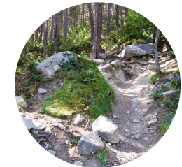
Camí del Riu Blanc

A la parròquia d'Encamp hi trobem l'estany d'Engolasters, provinent del riu d'Engolasters, afluent del Valira. La llegenda diu que aquí hi havia un poble de descreguts que va ser engolit per l'aigua. De nit s'hi concentraven les bruixes, que es banyaven a l'aigua de l'estany, nues. Els habitants masculins d'Engolasters pujaven a espiar-les, però si algun era descobert, les bruixes el transformaven en gat negre. Es diu que les bruixes devien desaparèixer a principis del segle XX, coincidint amb la instal·lació de les antenes de Ràdio Andorra i la construcció d'una presa per a la central de les Forces Hidroelèctriques d'Andorra (FHASA), inaugurada el 1934.