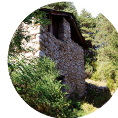
Borda del Cresper