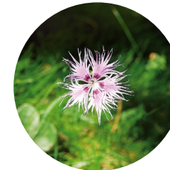
Clavell de pastor ( Dianthus hyssopifolius )