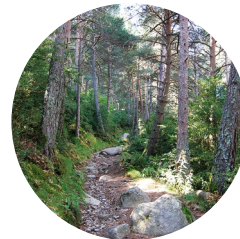
Camí del Cresper