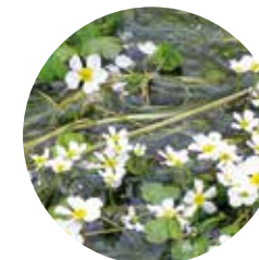
Ranuncle aquàtic ( Ranunculus aquatilis )

La vall que s'obre a la dreta pujant pel port d'Envalira en direcció a França, dins de la Parròquia d'Encamp, amaga un recorregut molt interessant per una successió d'estanys comunicats entre sí, alguns estanyols sense nom, rierols, espadats rocallosos, prats i àmplies panoràmiques, tot això enclavat al cor del circ glacial granític més gran del Principat d'Andorra. El GR7 i el GRP comparteixen traçat per aquest circ, i està coronat per cims de més de 2.700 metres, com és el cas de la collada dels Pessons, que en fa 2.816.