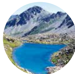
Estany del Cap dels Pessons