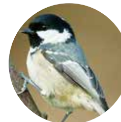
Mallerenga petita ( Parus ater )