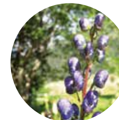
Tora blava ( Aconitum napellus )

El paisatge natural de tota la vall d'Ensagents alterna trams oberts amb d'altres de més íntims i tancats, amb zones humides i de gran interès florístic.