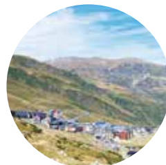
El Pas de la Casa