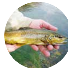
Truita fario o comuna ( Salmo trutta fario )