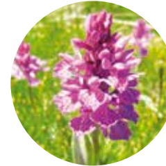
Orquídea majalis ( Dactylorhiza majalis )