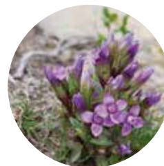
Gentiane des champs ( Gentianella campestris )