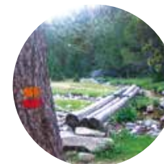
Pasarela del Estall Serrer

El itinerario de la Maiana es una de las excursiones más fantásticas del Valle del Madriu-Perafita-Claror, ya que se pasa por Entremesaigües, el refugio de Perafita y el collado de la Maiana, con la posibilidad de llegar al lago de la Nou. De bajada pasamos por el refugio de Fontverd y por Ràmio (conjunto de bordas típicas de Andorra).