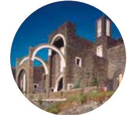
Basílica Santuari Nostra Senyora de Meritxell

Aquest itinerari es troba a la parròquia de Canillo, i s'inicia molt a prop del poble de Meritxell. Com el seu nom indica, és un camí que passa per un salt d'aigua impressionant. El camí ens porta des del conjunt de bordes de Molleres, situades al costat de la Basílica Santuari de Meritxell, fins al Toll Bullidor.