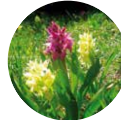
Orquidea sambucina ( Orchis sambucina )