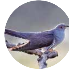
Cucut ( Cuculus canorus )