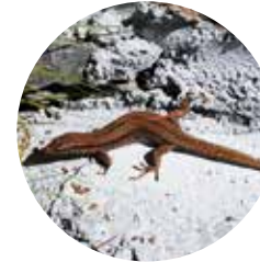
Serenalla roquera ( Podarcis muralis )