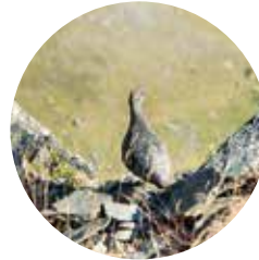
Perdiu blanca ( Lagopus muta )