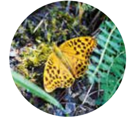
Papallona ( Argynnis paphia )

Aquesta excursió surt des del casc antic del poble d'Arinsal. A l'hivern, és un dels peus de pista per accedir a Vallnord (directament del poble a l'estació, a través d'un telecabin) i quan la neu es fon és el torn dels excursionistes que accedeixen al Parc Natural del Comapedrosa.