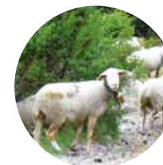
Brebis sur le chemin

Le chemin de Manyat part du petit village de Certers, un petit hameau blotti au pied de la Serra de la Creu. Juste à l'entrée du village, notre chemin sort de la route principale sur le côté gauche. La première partie du parcours, comprise entre cet endroit et les Cortals de Manyat, correspond à une partie d'un sentier de Grande Randonnée (GR).