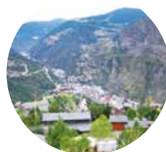
Sant Julià de Lòria