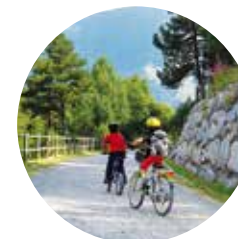
Excursionistes pel camí de les Pardines