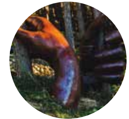
Jardins de Juberrí

L'itinerari que aquí es presenta té sortida al poble de Juberrí, i correspon a un tram del GRP, Gran Recorregut País, que fa tota la volta a Andorra. El punt de sortida es troba envoltat de pollancre ( Populus nigra ) i freixeres ( Fraxinus excelsior ), que aprofiten la humitat d'una petita riera.