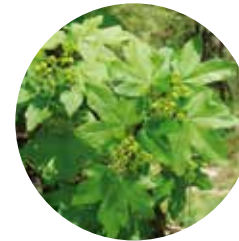
Auró blanc ( Acer campestre )