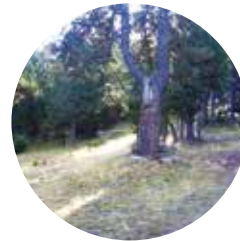
Arribant a Conangle

Juberrí: del llatí iugus , "jou", amb la terminació erri , del basc, "lloc o poble". D'aquest nubi urbà, n'apareixen diverses denominacions i, potser, agrupaments separats.