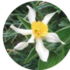
Grandalla ( Narcissus Pseudonarcissus )

Laurèdia: segons Joan Coromines, és el nom antic de Lòria (Sant Julià de Lòria) que, segons l'Acta de consagració de la catedral de la Seu de 839, seria el nom de persona llatí Lauridius , tot i que caldria veure també Salòria, ja que sembla contenir la mateixa denominació i ací l'ús de l'article indicaria un nom apel·latiu a l'aigua.