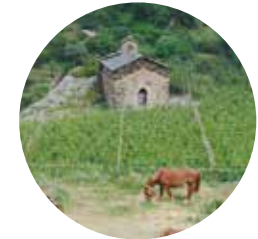
Sant Mateu de Pui d'Olivesa

Fantàstic itinerari circular a la parròquia de Sant Julià de Lòria, on podem descobrir els indrets més desconeguts de la vall del sud. L'alternança de zones obertes amb espectaculars vistes a la parròquia i zones d'imponents boscos fa que sigui molt interessant des del punt de vista paisatgístic.