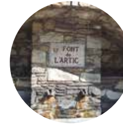
Font de l'Artic