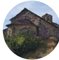
Sant Serni de Nagol

Nagol: Segons el llibre "Recull topogràfic per la seca, la meca i les Valls d'Andorra", significaria "olla d'aigua". Etimologia llatina aquale amb l'aglutinació de la preposició -en; la qual cosa dóna En Agol .