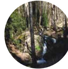
Riu de Llumeneres