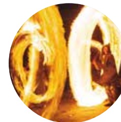
Fête du feu