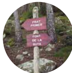
Indicateurs pendant le parcours

Prat Primer : « prat » (pré) signifie extension de terre où pousse l'herbe des pâturages. Le nom Prat date de 269 et son étymologie provient du latin pratu, à la même signification.