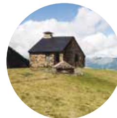
Refuge de Prat Primer