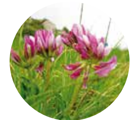
Regalèssia de muntanya ( Trifolium alpinum )

L'estany de Juclà es troba al nord-est d'Andorra, a la parròquia de Canillo. Aquesta parròquia, amb una superfície de 120,76 km 2 , és la primera parròquia per ordre protocol·lari, i la més extensa del principat.