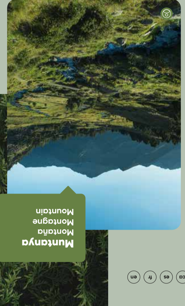
Muntanya Montaña Montagne Mountain