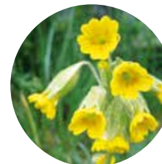
Cucut ( Primula veris )