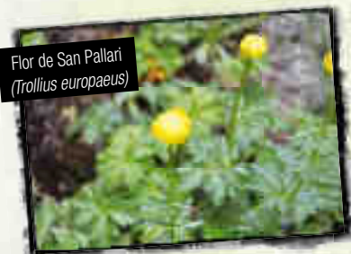
Flor de San Pallari ( Trollius europaeus )