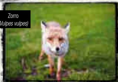
Zorro ( Vulpes vulpes )