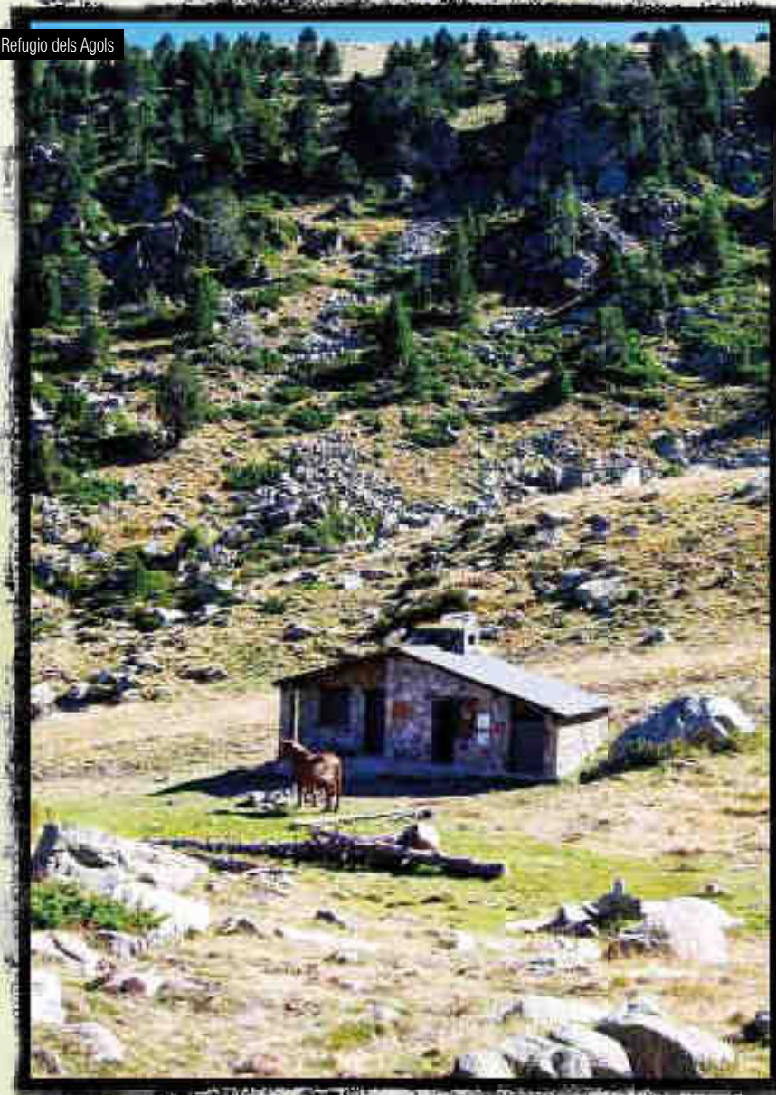
Refugio dels Agols

no te pierdas... el mirador del bosque de l'Allau, situado a unos 50 metros de la nueva Iglesia de Sant Jaume dels Cortals, un mirador que está completamente integrado dentro del bosque y la naturaleza, entre pinos rojos y algún abeto.