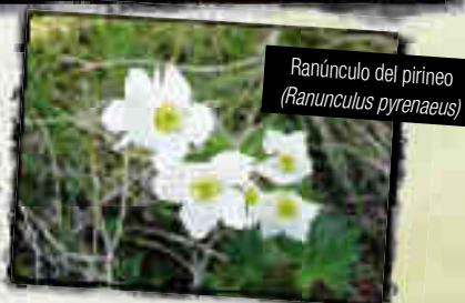
Ranúnculo del pirineo ( Ranunculus pyrenaeus )